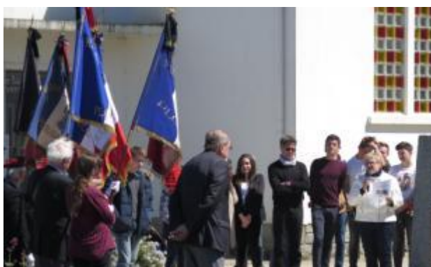
Cérémonie au pied d'une stèle