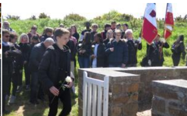
Au pied des stèles chaque élève dépose une rose