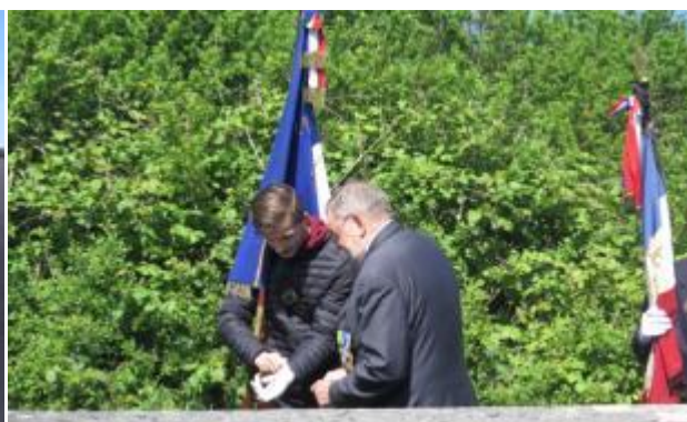
Apprentissage du métier de Porte-Drapeau