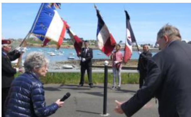
Cérémonie au port du Diben, de Plougasnou